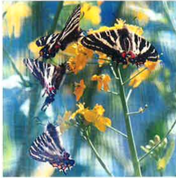
ギフチョウとナノハナ