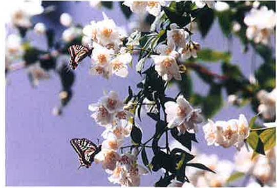
アゲハチョウとウズキノハナ